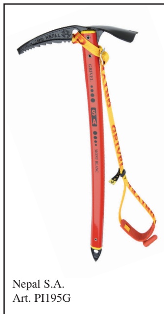
Nepal S.A. Art. PI195G

Grivel srl Strada Larzey-Entreves 17/d 11013 Courmayeur (Aosta) Italy Phone +39.0165.843714 Fax +39.0165.844800 www.grivel.com info@grivel.com