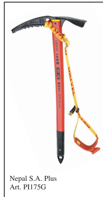
Nepal S.A. Plus Art. PI175G